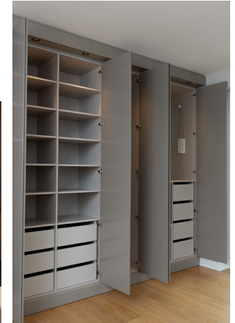
11 Beispiel Kleiderschrank