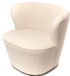
3 Sessel HARVEY