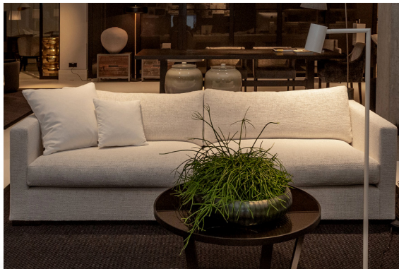
1 Sofa CLASSICO