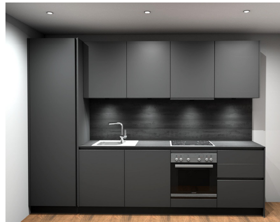
7 Beispiel Küche