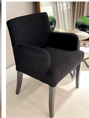
9 Stuhl EMU