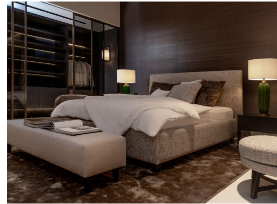
12 Bett CERES 1,60 x 2,00 m