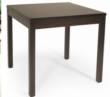
8 Esstisch Massivholz schwarz