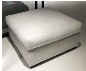
2 Hocker CLASSICO